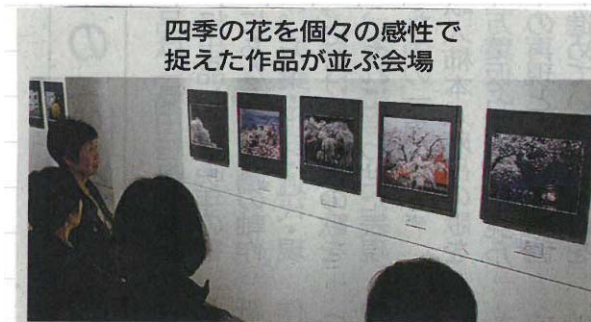
四季の花を個々の感性で捉えた作品が並ぶ会場

四季折々の花 瞬間切り取る 北広島で写真展 北広島町芸北地域を拠点に活動する写真愛好家グループ「芸北写真塾」の作品展が、同町有田の商業施設